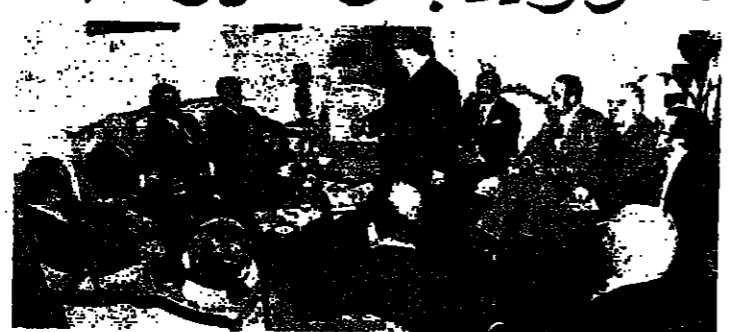
الرئيس الصلح يتحدث السيد محمد يوسف الطنطاوي، والوزير ياس خلف وخالد جنبلاط، والسيد شفيق الزوران